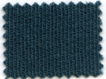
9667 ● hunter