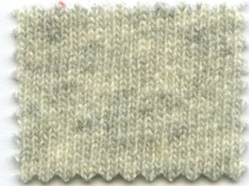
2162 ● perla