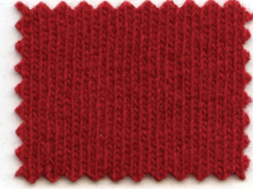
5200 ● porpora