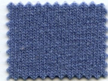
35260 ● cendre blue