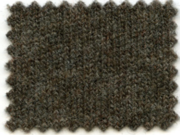
331 ● talpa