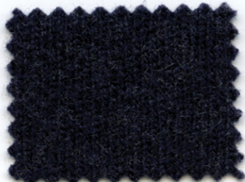
2160 ● caspio