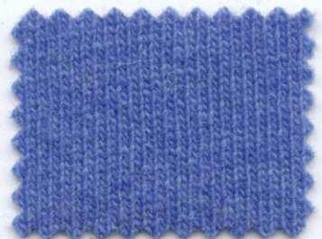
2286 ● ceruleo