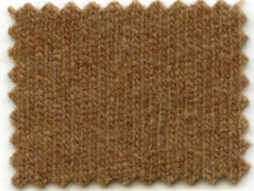
2142 ● fulvo