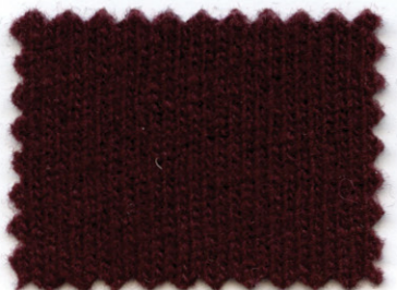
351 ● amarena