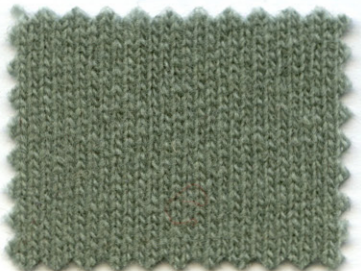
3681 ● laurel