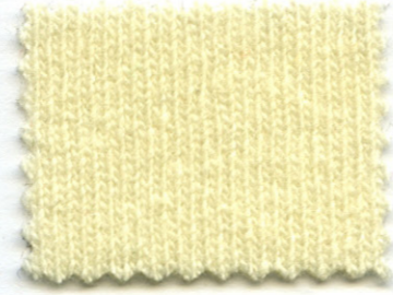
999 ● naturale