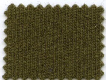
2681 ● muschio