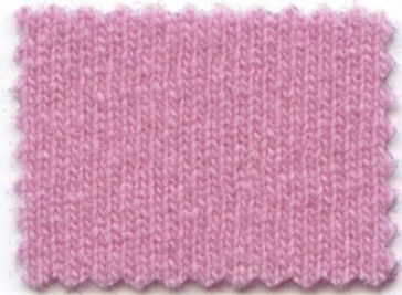
3677 ● mauve