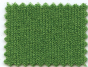
35317 ● smeraldo