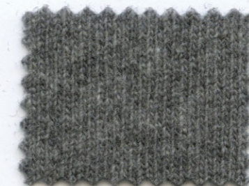
654 ● smog