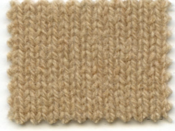
9671 ● nocciola