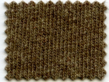
206 ● sabbioso