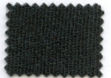
2148 ● alloro