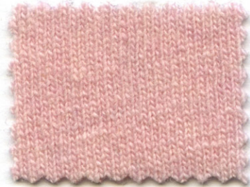
2187 ● delicato