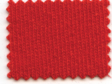
227 ● ciliegia