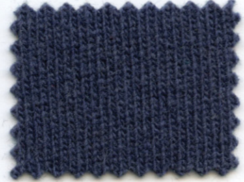
3678 ● slash