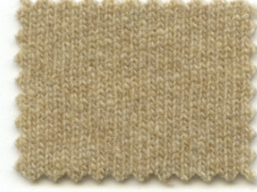
203 ● bambù