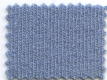
3679 ● lobelia