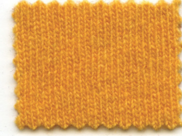
2279 ● mandarino