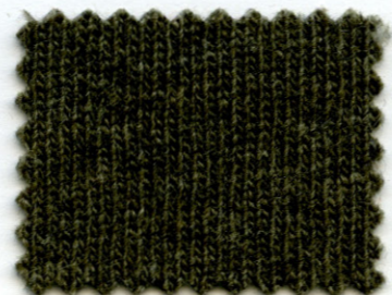
837 ● militare