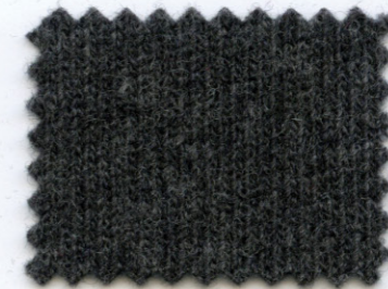
655 ● grafite