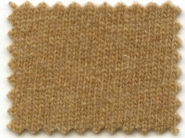
811 ● tortilla