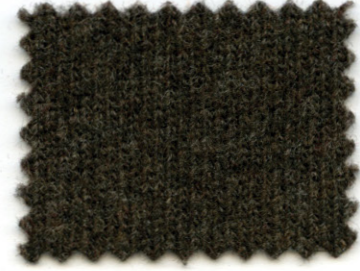
2144 ● tronco