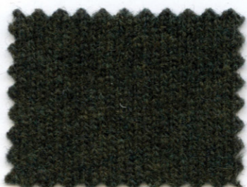
230 ● palude