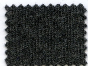
4675 ● antracite