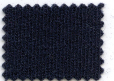
824 ● notte