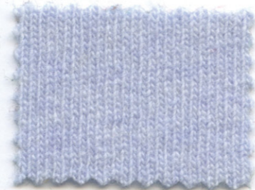
2003 ● sogno