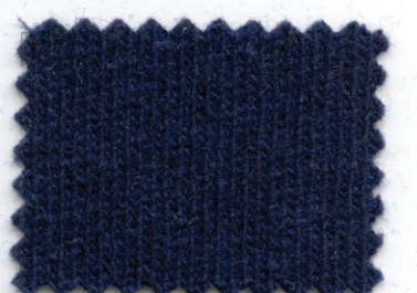
728 ● oltremare