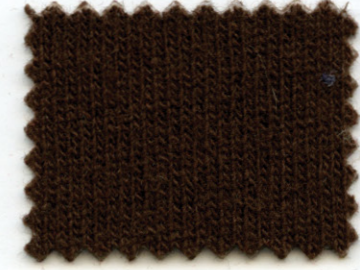
35209 ● africa