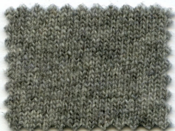
621 ● cenere