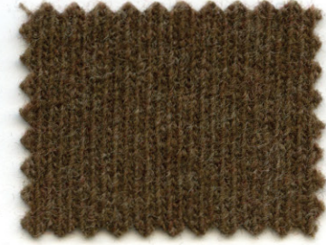
204 ● cacao