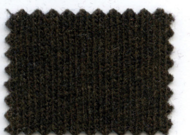
278 ● bruno