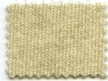
502 ● pergamena