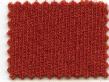
713 ● tabasco