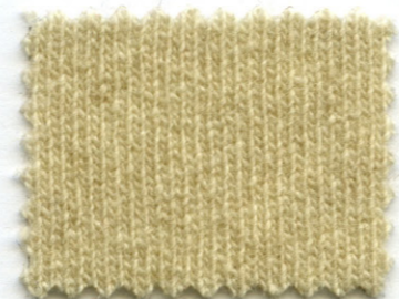
770 ● ostrica