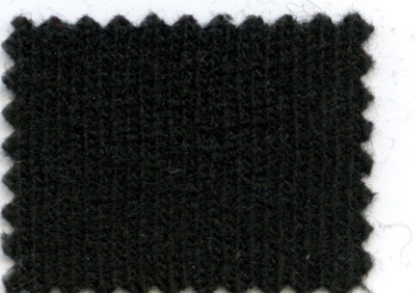
02 ● nero